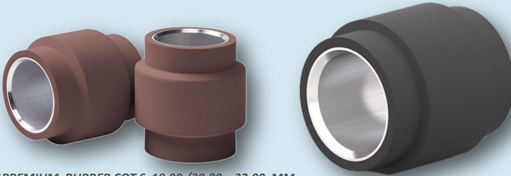
*PREMIUM RUBBER COT S 19.00 /30.00 x 32.00 MM