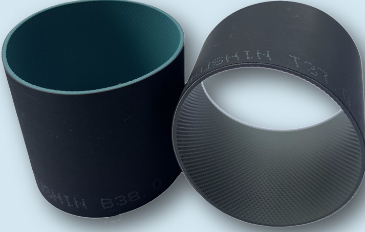
*TOP APRON BAND 37.00 x 32.00 x 1.00

DÜNYA AIRJET İPLİK VE MAKİNA ÜRETİCİLERİNİN 1 NUMARALI TERCİHİ